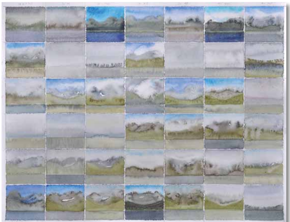
Silvretta-Tagebuch, 2014 Aquarell, 65 x 84 cm